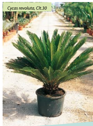
Cycas revoluta, Cl.t.30