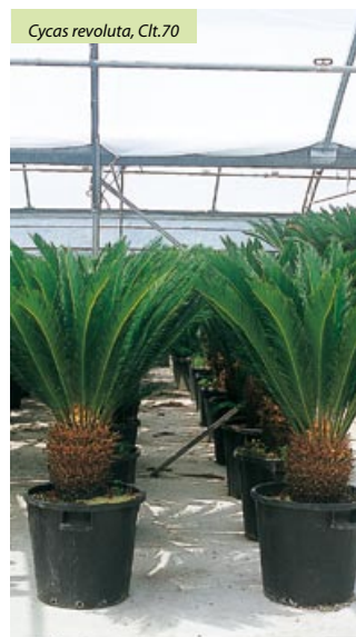
Cycas revoluta, Cl.t.70