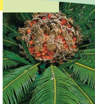
Cycas revoluta fleur male, male flower

EXEMPLAIRES: PRIX SUR DEMANDE SPECIMENS: PRICES ON REQUEST