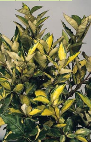
Elaeagnus x ebbingei "Limelight"

Evergreen shrub, upright, densely branched, some branches have thorns. Lanceolate, acuminate leaves, 4-8cm long, 3-4.5cm wide, vivid, dark green at the edges and a large, irregular yellow central strip. Some branches bear only dark green leaves. Same growing requirements and use as Elaeagnus x ebbingei.