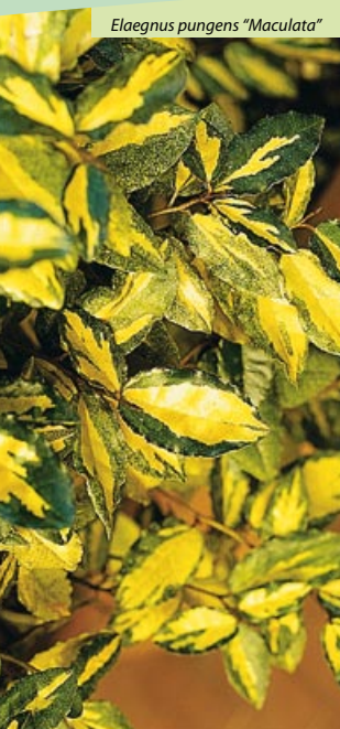
Elaeagnus pungens "Maculata"