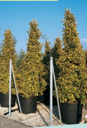
Elaeagnus x ebb. Gilt Edge cône, cone