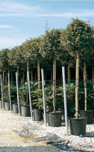
Elaeagnus x ebbingei tige, standard