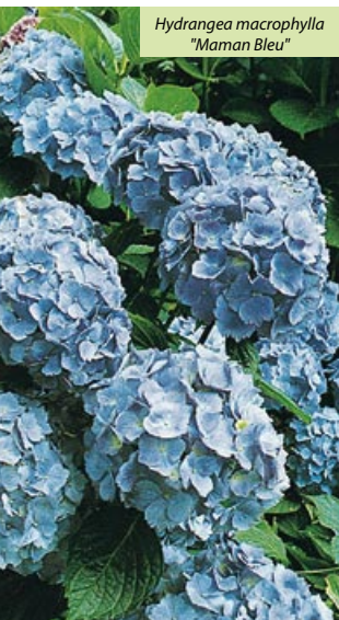
Hydrangea macrophylla "Maman Bleu"