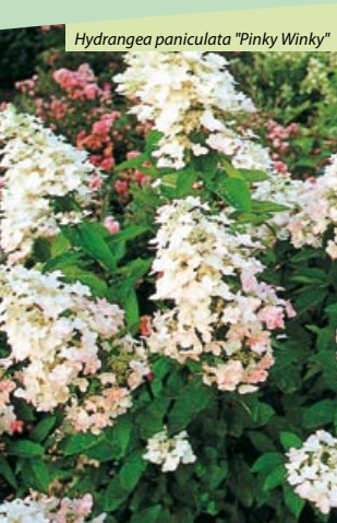
Hydrangea paniculata "Pinky Winky"