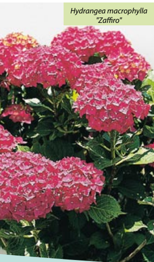
Hydrangea macrophylla "Zaffiro"