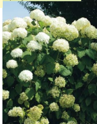
Hydrangea arborescens "Annabelle"