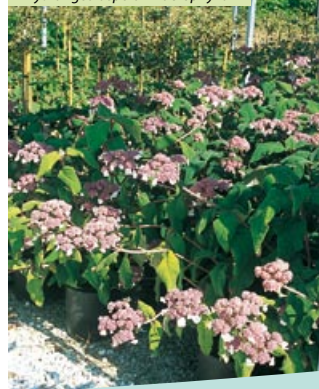
Hydrangea aspera "Macrophylla"