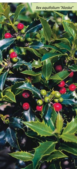
Ilex aquifolium "Alaska"