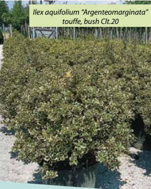
Ilex aquifolium "Argenteomarginata" touffe, bush Cl.t.20

The most beautiful and ornamental of all hollies. Evergreen shrub which grows irregularly in the first years, sometimes conical and sometimes rounded, but always dense. Later, if conveniently pruned (it withstands pruning very well), it becomes widely pyramidal. When grafted at the height of about 1 meter it becomes a half standard tree with round crown, one of the most popular. Leaves from ovoidal to lanceolate, up to 8cm long and 4cm wide, leathery and unevenly undulate at the edges with 7-9 prickly teeth on both sides and one sharp tooth at the tip. When the leaves begin to form in late spring they are tinged with purple creating an attractive contrast with the leaves already present. They then turn glossy, dark green, unevenly variegated in silvery-white which later turns creamy-white. Some leaves are half or completely yellow. Fruit: very abundant on female plants, the same as Ilex aquifolium. Soil and growing requirements: the same as Ilex aquifolium. Use: planted singly, in groups or with other plants, in hedges. As half standard: in geometrical gardens, in the centre of borders. In pot it is an important feature on balconies, patios and verandas.