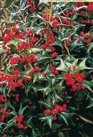
Ilex cornuta "Dazzler"