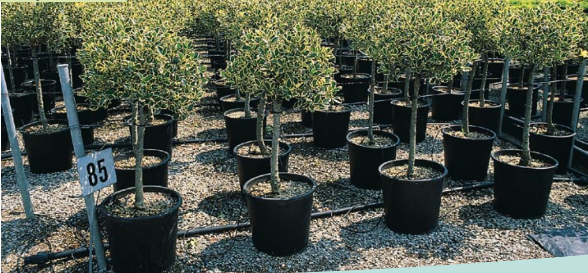
Ilex aquifolium "Argenteomarginata" demi-tige, half standard Cl.t.18