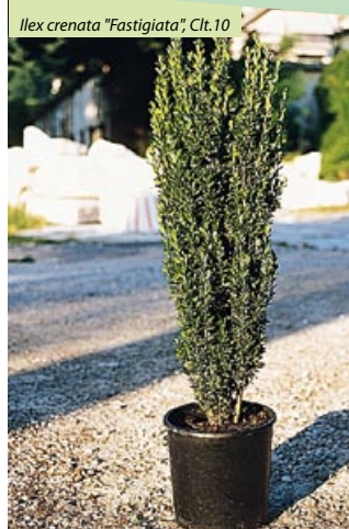
Ilex crenata "Fastigiata", Cl.t.10