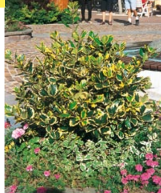
Ilex aquifolium demi-tige, half standard, LV100