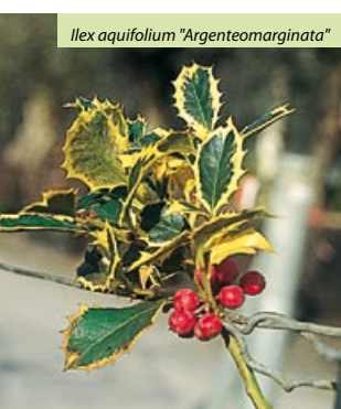
Ilex aquifolium "Argenteomarginata"