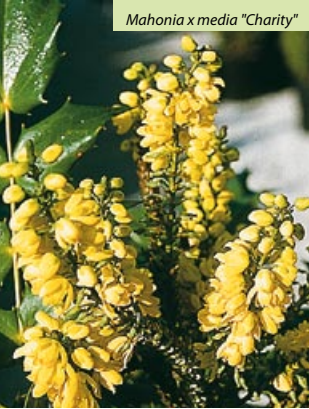
Mahonia x media "Charity"

Origin: central and North America. Evergreen shrub, bushy, upright habit. Leaves up to 25cm made up of glossy green, elliptic leaflets with thorny edges, reddish-purple in winter. Golden yellow flowers in March-April, clustered in dense racemes, followed by very showy, bluish-black fruit. No particular requirements regarding soil, tolerates calcareous. Withstands pruning and will also live beneath old trees as it is able to withstand competition from their roots. Use: maquis, borders and hedges.