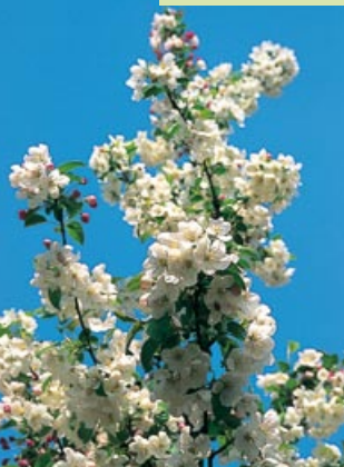
Malus "John Downie"