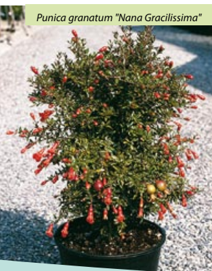
Punica granatum "Nana Gracilissima"