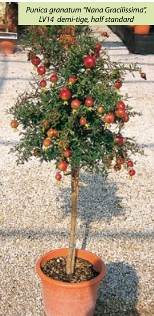
Punica granatum "Nana Gracilissima", LV14 demi-tige, half standard