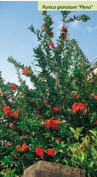
Punica granatum "Plena"

Upright, deciduous shrub with branches which have few or no thorns. Elongate leaves, narrow, 3-8cm, glossy green which turn yellow in autumn. Double flowers, larger than the pomegranate fruit tree, red orange with creamy-yellow streaks, at the end of the branches of that year. The flowers are followed by small fruits which are sporadic and not numerous. Growing requirements are the same as Punica granatum.