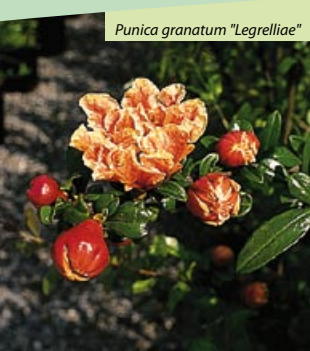
Punica granatum "Legrelliae"