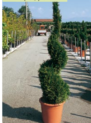
Thuja occidentalis "Smaragd" demi-tige, half standard