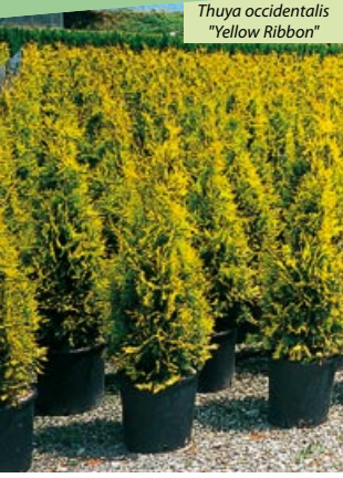
Thuja occidentalis "Yellow Ribbon"