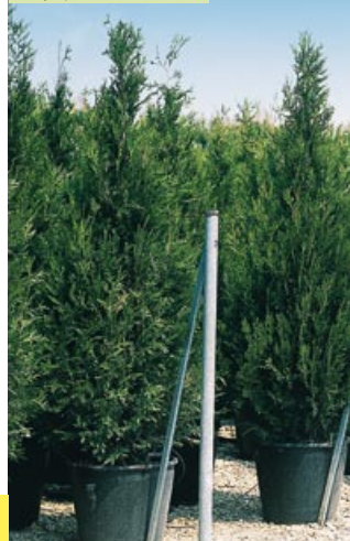
Thuya plicata "Atrovirens"