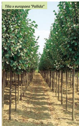
Tilia x europaea "Pallida" palissée sur tige, pleached