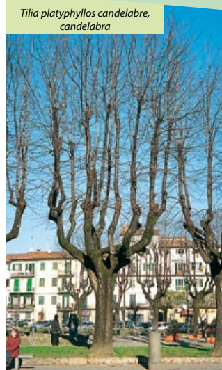
Tilia platyphyllos candelabre, candelabra