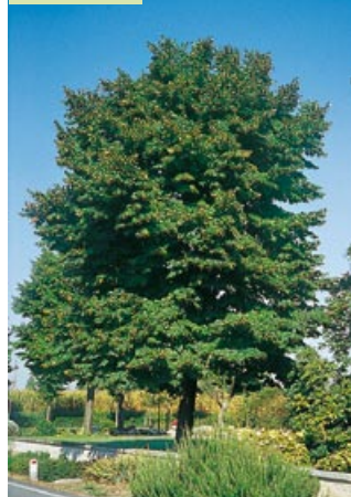
Tilia x euchlora

Origin: hybrid of Tilia cordata and T. dasystyla. Medium sized deciduous tree with conical-round crown formed from fairly strong branches, upright and horizontal in the upper part, and the lower part is weeping (reaching the ground if they have space to develop). Leaves: orbiculate-ovate, 5-10cm long, slightly toothed, finely pointed, bright green on the upper side, pale green underneath. Flowers: in June-July, bright yellow, grouped in clusters of 3-7. Fruit: from ovoidal to elliptic, slightly ribbed. Growing requirements and use: the same as T.cordata. This Lime tree is considered to be the most resistant to aphids.