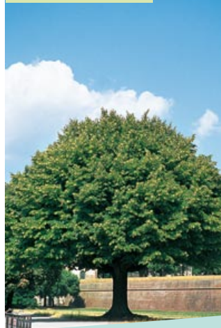
Tilia flavescens "Glenleven"

Origin: USA. Large deciduous tree with straight trunk and evenly arranged branches forming a round crown. Deeply toothed leaves, 6-10cm long, bright green, among the latest to fall. Adapts to various types of soil but grows better in fairly moist, permeable soil. Use: parks, wide streets.