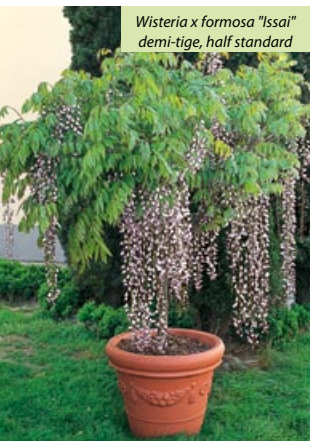
Wisteria x formosa "Issai" demi-tige, half standard

Twining, climbing plant with deciduous leaves similar to W. floribunda but which fall late. Pale purple and dark purple flowers in dense clusters from 25-35cm long which open successively starting from the base in May-June. Suitable for growing in a bush and pyramid. Tolerates half shade. Soil and use: the same as W. floribunda.