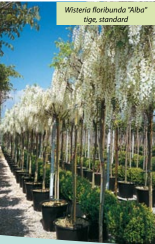
Wisteria floribunda "Alba" tige, standard