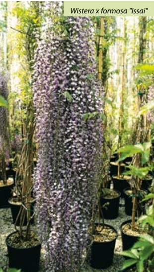
Wisteria x formosa "Issai"

Origin: Japan. Deciduous, climbing plant, very twining. Imparipinnate leaves made up of 11-19 elliptic leaflets 4-8cm, bright green, yellow in autumn. Purple-blue flowers grouped in clusters, 20-50cm long which open successively from the base in May-June, one week later than Wisteria sinensis, followed by fruit in long pods which contain toxic seeds. Adapts to all types of soil except too compact or stagnant. Use: to adorn walls, fences, pergolas etc. When it is planted at the base of an old tree it soon covers it, right to the top. It can be grown as a tree with twisted trunk and broad, round crown.