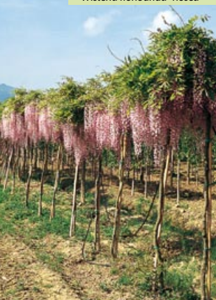
Wisteria floribunda "Rosea"